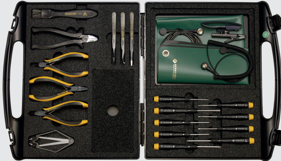
Außenmaße: 350 x 310 x 65 mm (geschlossen)

das professionelle Sortiment für den ESD-Profi im stationären und im mobilen Einsatz